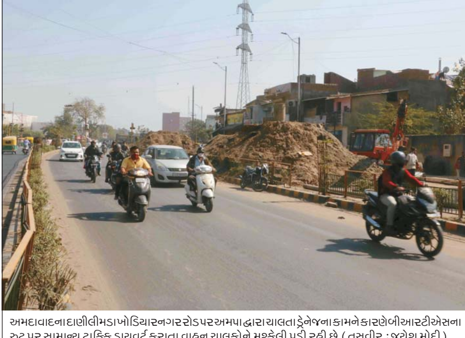
અમદાવાદના દાણીલીમડા ખોડિયા સ્વચ્છતા સેનાના દ્વારા આયોજાયેલા કારણેની આરટીએસના રુટ પર સામાન્ય ટ્રાફિક ડાયવર્ટ કરાતા વાહન ચાલકોને મુશ્કેલી પડી રહી છે.